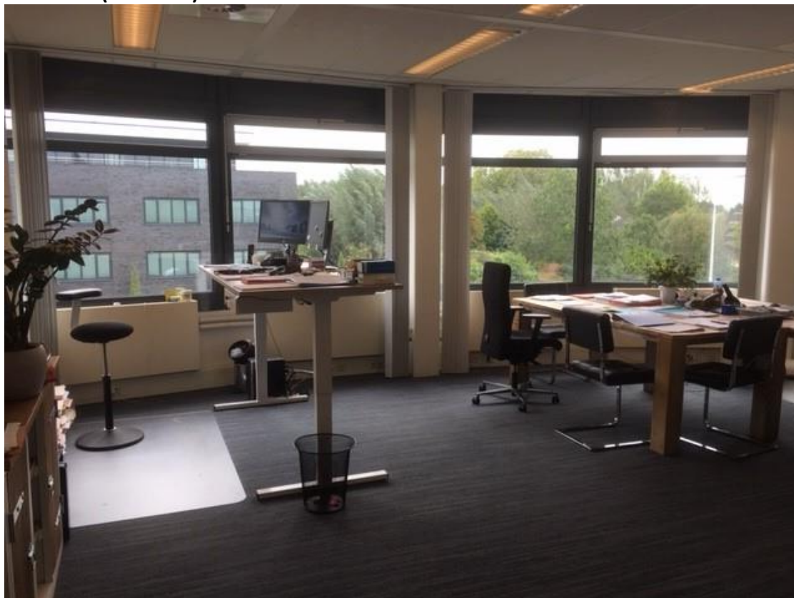
Kamer 16 (unit 2.01) 46 m 2 netto