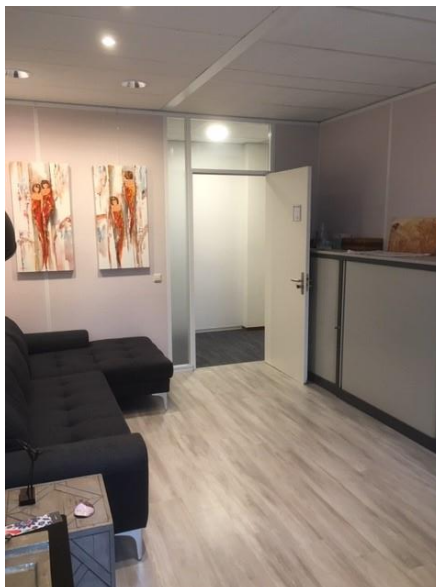
Kamer 12 B (unit 1.03) 20 m 2 netto